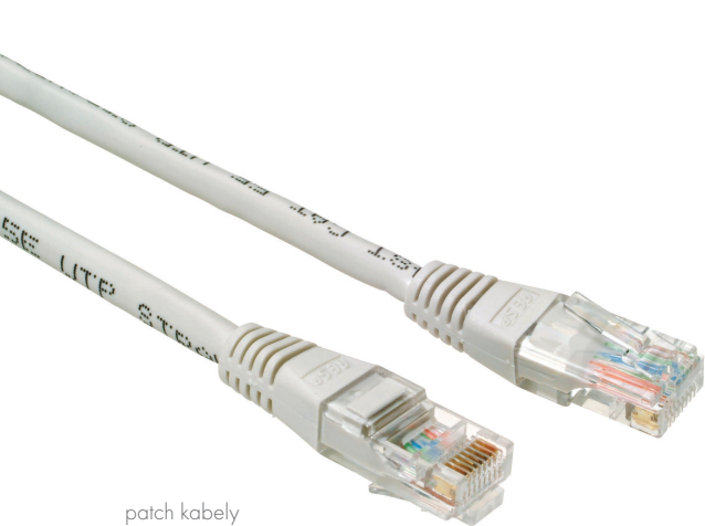
patch kabely s non-snag-proof ochranou