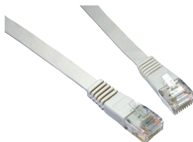
ploché patch kabely