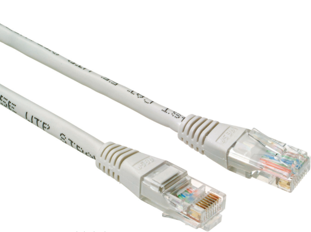
patch kabely s non-snag-proof ochranou